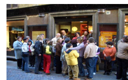
Un momento dell'inaugurazione della Bottega del Commercio Equosolidale

Orari: Lunedì chiuso Martedì-Sabato 8,30 - 12,30 15,30 - 19,30