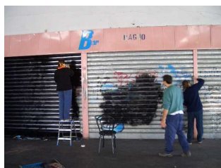
I lavori di allestimento di Spazioper a Cossato

Particolare cura e notevoli sforzi creativi hanno caratterizzato la fase di allestimento dei locali per rendere esteticamente accogliente e gradevole un luogo dove i ragazzi sentano di essere liberi di esprimersi attraverso "linguaggi", "schemi", "codici" adeguati.