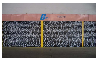
Spazioper... Le decorazioni esterne

Si inaugura il 12/11 il Bar di Spazio Aperto un progetto di Cooperativa Maria Cecilia e Cooperativa Tantintenti