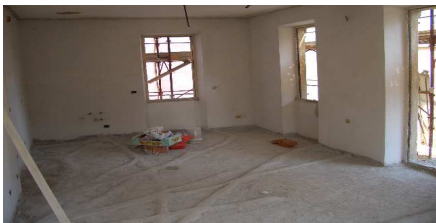
Locali intonacati in Casa Lions